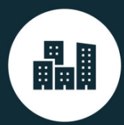
DÉVELOPPEMENT résidentiel et commercial