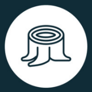
EXPLOITATION NON DURABLE DES RESSOURCES