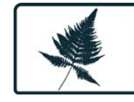
ESPÈCE FLORISTIQUE EN SITUATION PRÉCAIRE