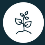
ESPÈCES ENVAHISSANTES exotiques et indigènes