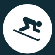
ACTIVITÉS récréatives et développement touristique