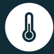
CHANGEMENTS CLIMATIQUES et POLLUTION