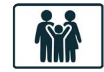
QUALITÉ DE VIE