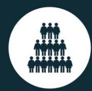
SURFRÉQUENTATION des parcs et des milieux naturels